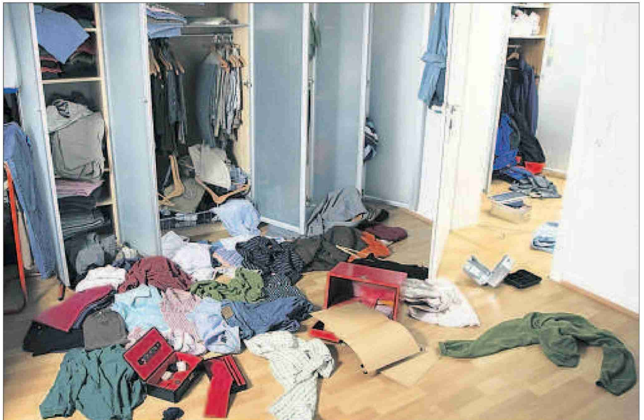
Schmuck weg, Bargeld fort, Computer futsch: Wohnungseinbrüche verursachen Stress und Angst.